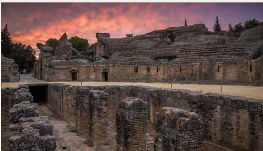
) Fossa bestiarum del anfiteatro

Itálica fue la primera ciudad romana fundada en la península Ibérica, en el año 206 a.C. No es mucho lo que conocemos de esa primera Itálica de época republicana, ya que los vestigios de ese periodo se encuentran en su mayoría bajo el pueblo de Santiponce, que se asentó sobre las ruinas romanas en 1603. El área visitable principal abarca los restos de la ampliación realizada en época altoimperial, bajo el mandato de Adriano (117-138 d.C.). Con esta nueva urbanización, caracterizada por