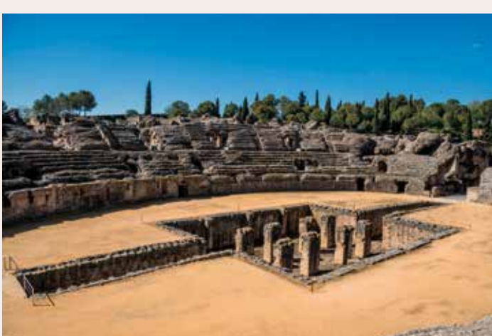
Vista interior del anfiteatro