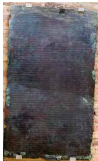
) Copia de la Ley Gladiatoria

Este anfiteatro fue uno de los más grandes del Imperio, con capacidad para unos 25.000 espectadores. Puesto que la población estimada de Itálica sería de unas diez o quince mil personas, se cree que durante los juegos el anfiteatro acogería a los habitantes de las ciudades cercanas y a viajeros. En Roma había muchos días festivos en los que se celebraban grandes fiestas, representaciones teatrales y juegos. Los juegos tenían lugar en el anfiteatro, edificio que recibe el nombre porque su forma constructiva equivale a la de dos teatros enfrentados. Los más importantes eran los ludi gladiatorii , o luchas