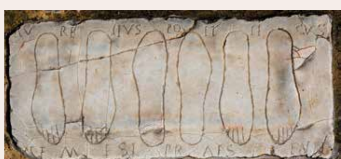
Placa votiva dedicada a Dea Caelestis/Nemesis

El foso, fossa bestiaria (9.1), es el lugar donde los animales salvajes aguardaban estacionados en sus jaulas, y estaba cubierto por un entarimado. En determinados momentos, para darle mayor emoción a la lucha, los animales eran liberados en la arena gracias a trampillas. En la avenida triunfal, la galería de entrada a la arena en el extremo oriental, se localiza un santuario consagrado a Dea Caelestis y Nemesis Augusta, diosas a las que están dedicadas las placas votivas con representaciones de pies empotradas en el suelo (9.2).