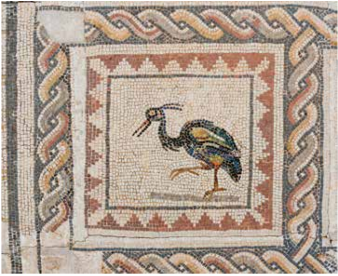
) Detalle del mosaico de los Pájaros