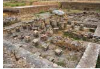
) Hypocaustum del área termal del edificio de Neptuno

Este inmueble ocupa una parcela de unos 6.000 m 2 , de la que se ha excavado apenas una cuarta parte. En él ha sido localizada un área termal (3.1) en la que destacan los restos de una sala caliente, el caldarium , identificable por los pilares de ladrillo del doble suelo o hypocaustum ; y otra fría, el frigidarium , pavimentada con el mosaico presidido por Neptuno, el dios del mar, acompañado por una comitiva de animales y otros seres marinos. Rodeando el mosaico, una cenefa representa escenas con pigmeos y animales del medio fluvial. En el extremo oeste de este edificio se ha documentado un ámbito de tipología doméstica con varios pavimen-