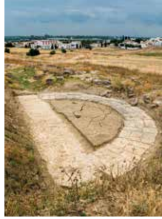
) Cimentación de una exedra monumental del Traianeum

ción, fue objeto de intenso expolio desde tiempos antiguos.