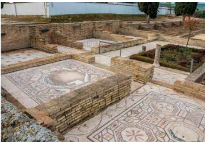
) Estancias domésticas privadas de la casa de los Pájaros

Es el exponente del tipo de casa que domina en este sector de la ciudad. Las domus de esta zona ocupan cada una, como mínimo, un área de 1.700 m 2 , articulando sus ámbitos en torno a un patio principal ajardinado, rodeado por una galería columnada, el peristilo (4.1). En una de las estancias que abren a este patio se sitúa el mosaico de los Pájaros (4.2), que da nombre a la casa. Gracias a su naturalismo podemos distinguir más de treinta especies, entre las que destacan un pavo real, un águila, un gallo, una paloma, una garza real o un loro. El emblema o cuadro central pudo representar una escena del mito de Orfeo, decorada con elementos musicales y teatrales. Al fondo de este peristilo encontramos dos patios interiores (4.3) con las estancias más privadas: uno de verano, con estanque; y otro más soleado, para el invierno, dominado por un jardín. Entre ambas áreas privadas tenemos el triclinium , comedor principal de la casa donde tuvieron lugar lujosas cenas. El larario, de planta semicircular y abierto al peristilo principal, es un pequeño altar doméstico donde se rinde culto a los lares, dioses protectores del hogar, de la familia y de los negocios. Rodeando la casa hacia la calle encontramos las tabernae , locales comerciales que el dueño de la casa alquilaba para ubicar casas de comida o tiendas (4.4).