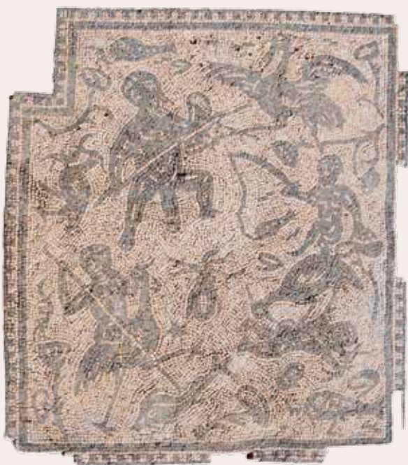
) Mosaico de los Pigmeos situado en la letrina del edificio de la Exedra

Tras el periodo romano y algunas centurias de abandono, la memoria de Itálica comenzará a recuperarse en los siglos XVI y XVII gracias, entre otros, al poeta y humanista Rodrigo Caro. A lo largo de los siglos siguientes esta recuperación continuará con los primeros estudios arqueológicos de la ciudad, como los realizados por fray Fernando de Zevallos, o por las excavaciones de Francisco de Bruna y los primeros hallazgos escultóricos de importancia. Durante el siglo XIX los viajeros románticos se ocupan de rescatar las glorias pasadas de este enclave, dando lugar al inicio de una conciencia de protección del yacimiento, que se materializa especialmente con Demetrio de los Ríos, de importancia capital en la recuperación de Itálica, y con su sucesor, Amador de los Ríos, que denunciará el continuo expolio de la ciudad. En 1912 la ciudad romana de Itálica fue declarada Monumento Nacional. Desde mediados de los años ochenta las labores de protección, conservación, investigación y difusión del Conjunto Arqueológico son competencia de la Junta de Andalucía.