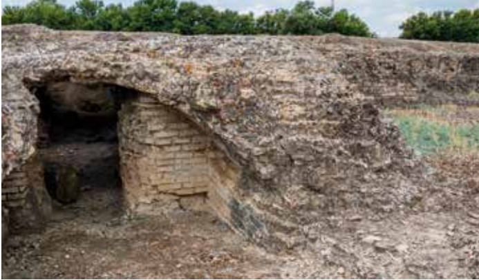
) Infraestructuras subterráneas de las termas Mayores

Las termas no eran solo un lugar para bañarse, sino que en él también se daban masajes, se practicaba el ejercicio físico, tenían biblioteca y sabarium ; eran un verdadero centro de encuentro social y cultural, donde hombres y mujeres de diversas clases tenían derecho a entrar, siempre por separado.