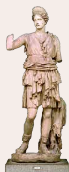
Escultura de la diosa Diana

Destacó en su pórtico el templo dedicado al culto de Isis, prácticamente idéntico, en sus dimensiones y en sus formas, al conservado en Pompeya.