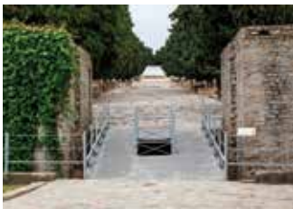
) Acceso a la calle principal de la ampliación adriana de la ciudad

Las murallas de Itálica llegaron a abarcar una superficie de más de 50 hectáreas y fueron edificadas en diversas fases. La muralla y las puertas por las que se accede al espacio visitable de la ciudad romana están fechadas en época del emperador Adriano. Esta ampliación urbana se caracteriza por un entramado de calles perfectamente trazado en ángulos rectos donde se dispone una retícula de parcelas rectangulares dotadas de pórticos en las aceras. Estas calles tienen unas dimensiones inusuales en una ciudad romana, alcanzando las más impor-