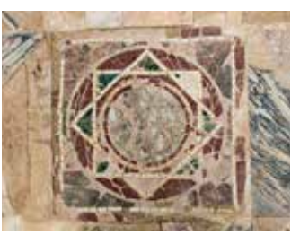
) Detalle del pavimento de opus sectile del edificio de la Exedra

edificio cuenta también con una letrina comunitaria, en la que destaca el pavimento, decorado con figuras de pigmeos (2.5). Pavimento singular: opus sectile . Mosaico realizado con piezas de mármol que normalmente presenta motivos geométricos.