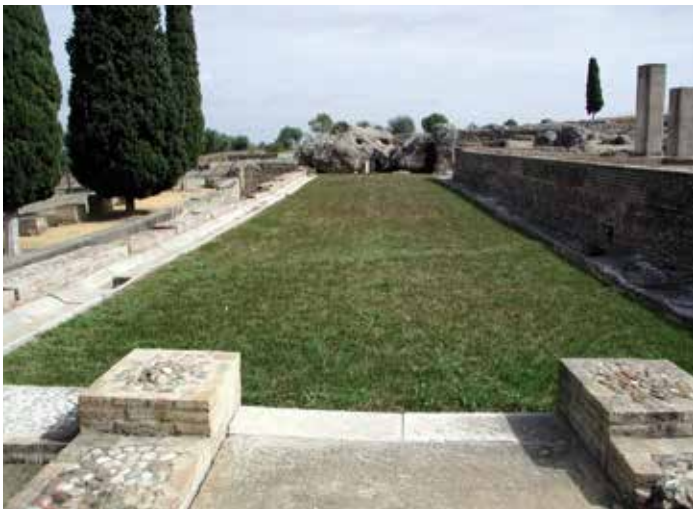
) Palestra del edificio de la Exedra

tantes los dieciséis metros de anchura. Y todo ello es propio del modelo helenístico que inspira la urbanización adriana.